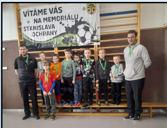
ml. přípravka - 6. místo - Bory