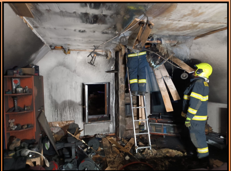
Požár rodinného domu č.p. 104 v Radostíně nad Oslavou dne 3.3.2025, kde zasahovala i naše jednotka PO