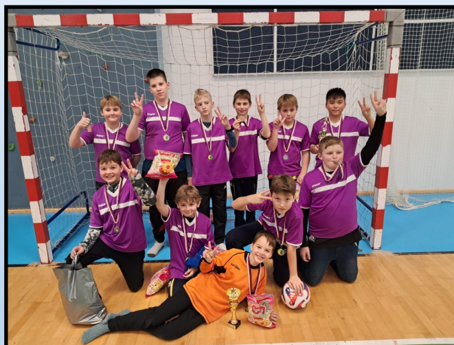
ml. žáci - 2. místo - turnaj ve Žďáře nad Sázavou