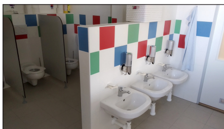
Nová 3. třída mateřské školy