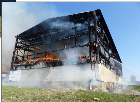
Požár seníku firmy ZERAS Radostín nad Oslavou