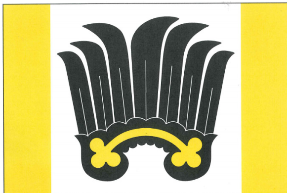
Schválená podoba obecní vlajky (návrh č.3).