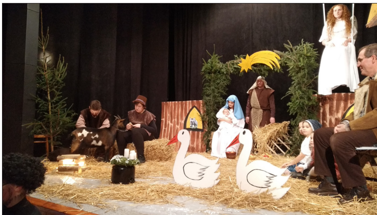
Fotografie z uspořádání letošního živého betlému v místním kulturním domě SDH