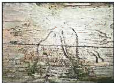
Obr. 3: Požerak lýkožrouta lesklého

části, jsou v kůře patrné vletové otvory (průměr otvoru cca 2 mm). Na patě kmene nebo za šupinami kůry pak zůstávají rezavohnědé drtinky, které kůrovci vyhazují z hlodaných chodbiček. Strom vzápětí po napadení kůrovci hyne, přesto koruna zůstává ještě určitou dobu zelená. Tyto stromy mohou ujít pozornosti a je proto potřeba v okolí nalezených stromů důkladně prohlédnout i stromy okolní. Napadené stromy doporučujeme pro lepší orientaci nejprve vyznačit (barvou, páskou nebo třeba sekýrkou) a pak teprve pokácet a provést asanaci.