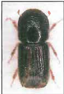
Obr. 1: Lýkožrout smrkový

Nejprve je třeba ověřit, jestli se skutečně jedná o lýkožrouta smrkového nebo lýkožrouta lesklého.