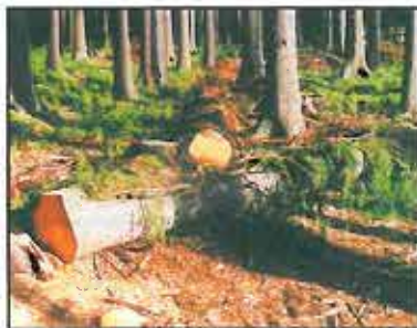
Obr. 4: Pokácený zdravý strom přikrytý větvemi slouží jako lapák

Lapák je pokácený zdravý strom, který se odvětví a větvemi přikryje (viz obr. 4).