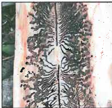
Obr. 2: Požerok lýkožrouta smrkového pod kůrou v lýku

larvy postupně rostou. Na konci larvální chodby se pak kuklí. Tímto postupem vzniká charakteristický požerok lýkožrouta smrkového (viz obr. č. 2).