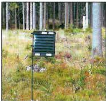
Obr. 5: Lapač

centrace převyšší 1 závrt/dm 2 , snižuje se účinnost a proto se musí kácet další. Důležitá je ale kontrola vývoje kůrovců - lapák je nezahubí, ale pouze odchytává. Proto pokud larvální chodby dosáhnou délky nad 3 cm, je potřeba zajistit asanaci - lapáky odvézt z lesa nebo odkornit. Na asanaci je potřeba myslet předem a pokud je riziko, že se nepodaří včas, je lepší zvolit druhou metodu - lapač.