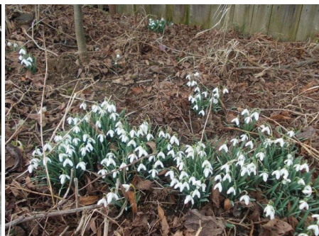
Fotografie z letošní zimy – únor 2014