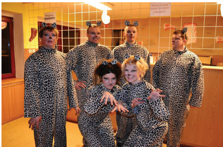
Z letošního divadelního plesu místních ochotníků

Obecní úřad žádá občany, aby přistavovali popelnice k vývozu již ve čtvrtek, přede dnem vývozu. Firma ODAS Žďár nad Sázavou zajišťující vývoz popelnic musí vzhledem k organizačním změnám jezdit některé svozové dny brzy ráno.