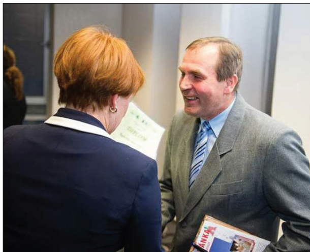
Vyhlášení soutěže „My třídíme nejlépe 2013“

v soutěži 131 obcí Kraje Vysočina obsadila Obec Radostín nad Oslavou 3. místo a za toto umístění obdržela od Kraje Vysočina finanční dar ve výši 20 000,- Kč?